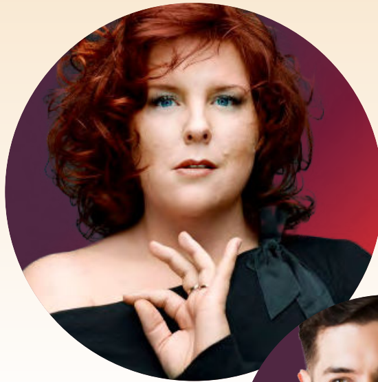
MARIE-NICOLE LEMIEUX, contralto FRANÇOIS ZEITOUNI, piano