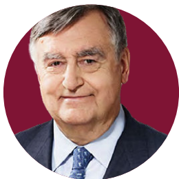
LUCIEN BOUCHARD C.P. G.O.Q., Ad.E., Associé, Davies Ward Phillips & Vineberg S.E.N.C.R.L.M