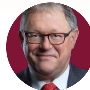
JACQUES CHAGNON Ancien président, Assemblée nationale du Québec